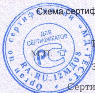
Схема сертификации 2.

Протокола проверки результатов услуг № 180422 от 05.12.2018